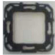
Piastra di montaggio