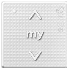
Modulo Smoove Origin io